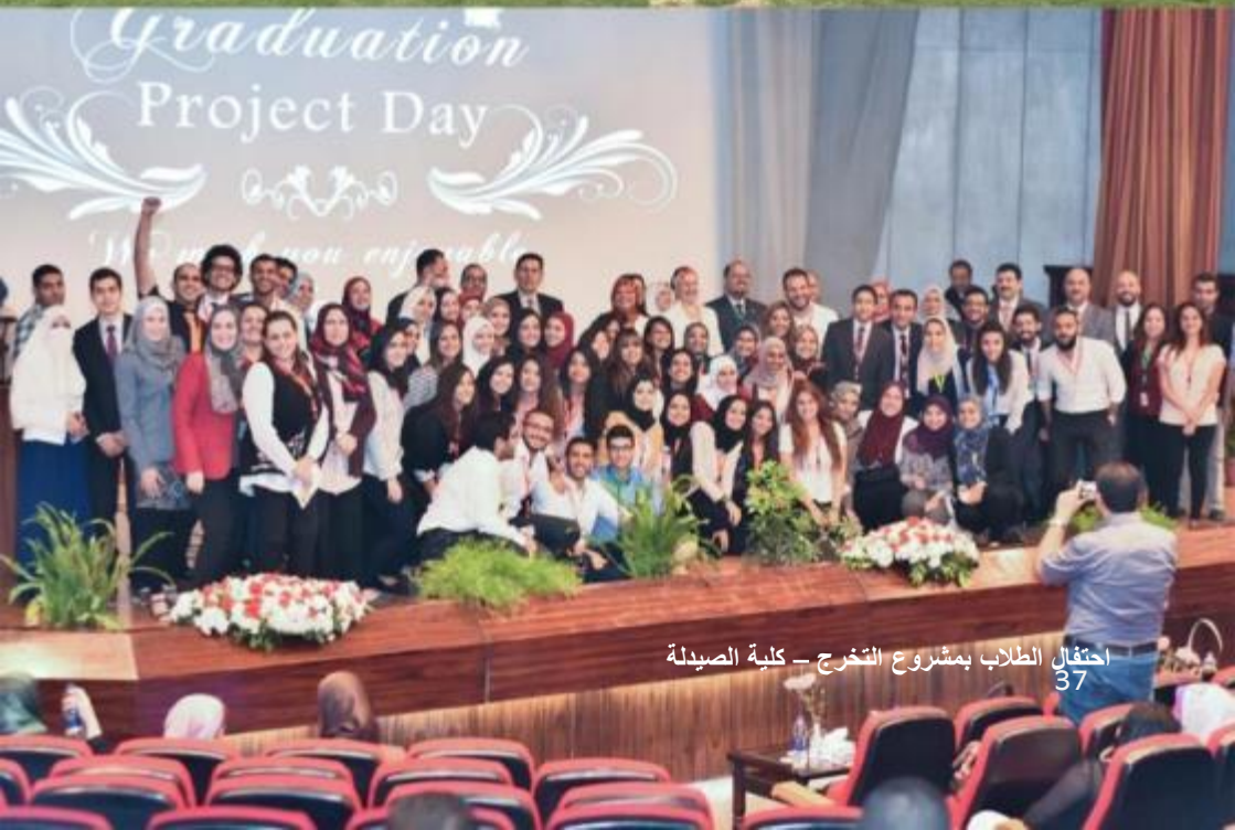
احتفال الطلاب بمشروع التخرج - كلية الصيدلة