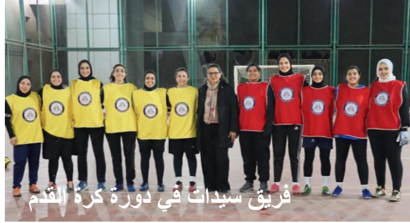
فريق سيدات في دورة كرة القدم

تعمل رابطة الخريجين على جمع مجتمع خريجي جامعة عين شمس معًا لتعزيز الروابط الهادفة مع بعضهم البعض، والمشاركة والتعلم من بعضهم البعض، والحفاظ على الرسالة التعليمية والتراث الغني وقيم جامعة عين شمس وتعزيزها.