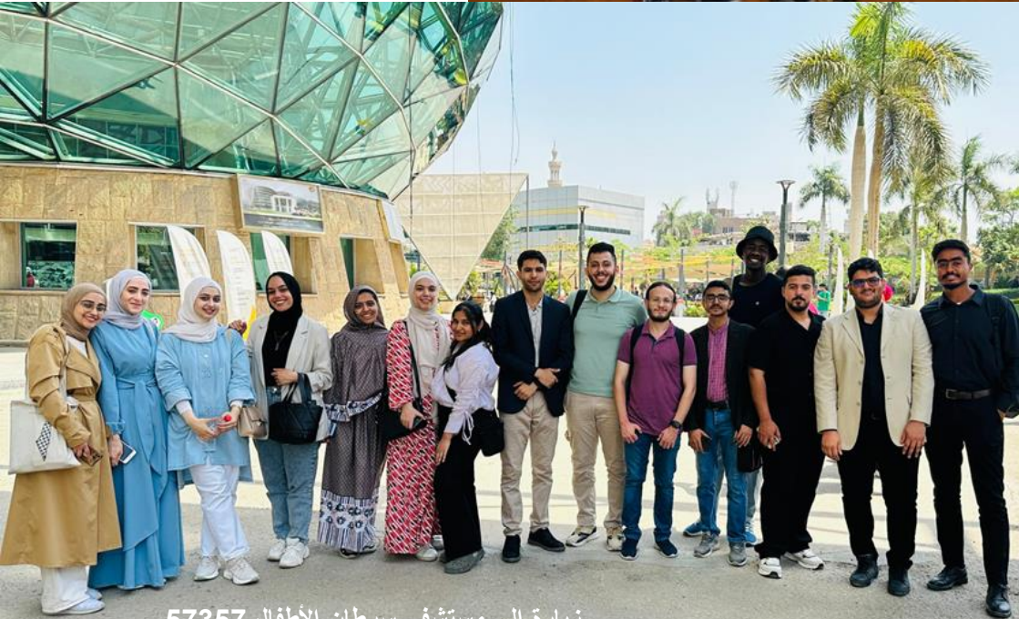
زيارة الى مستشفى سرطان الأطفال 57357