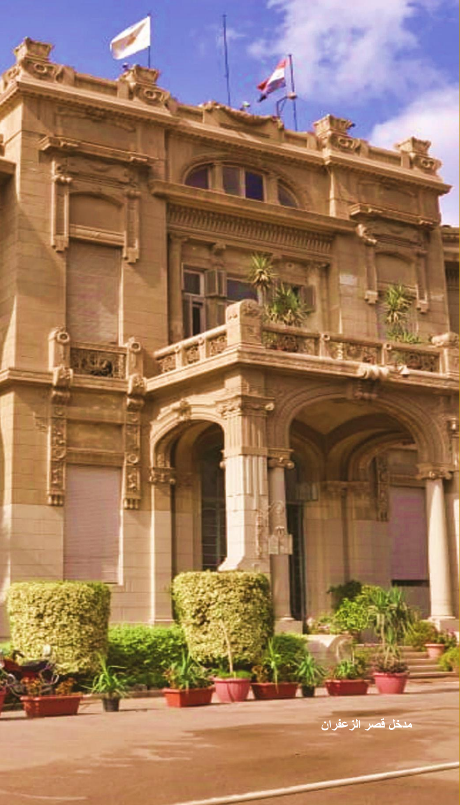
مدخل قصر الزعفران