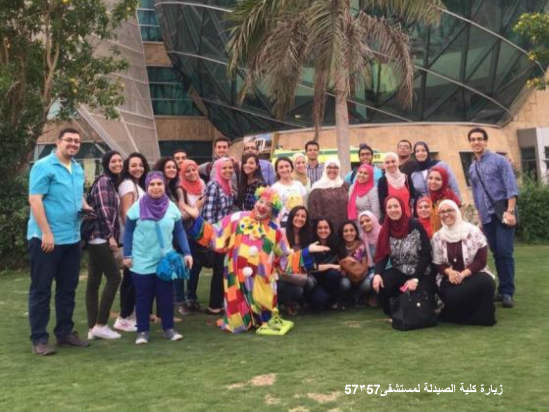
زيارة كلية الصيدلة لمستشفى 57٣57