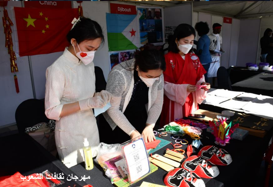
مهرجان ثقافات الشعوب