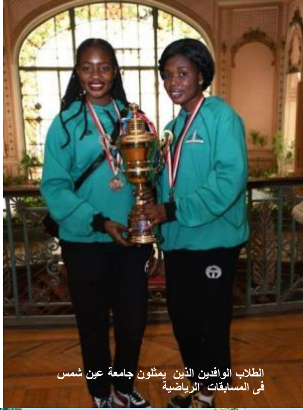
الطلاب الوافدين الذين يمثلون جامعة عين شمس في المسابقات الرياضية