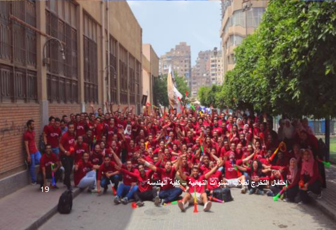
احتفال التخرج لطلاب السنوات النهائية - كلية الهندسة