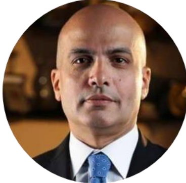
أ.د. محمد ضياء زين العابدين رئيس الجامعة والقائم بعمل نائب رئيس الجامعة لشئون التعليم والطلاب