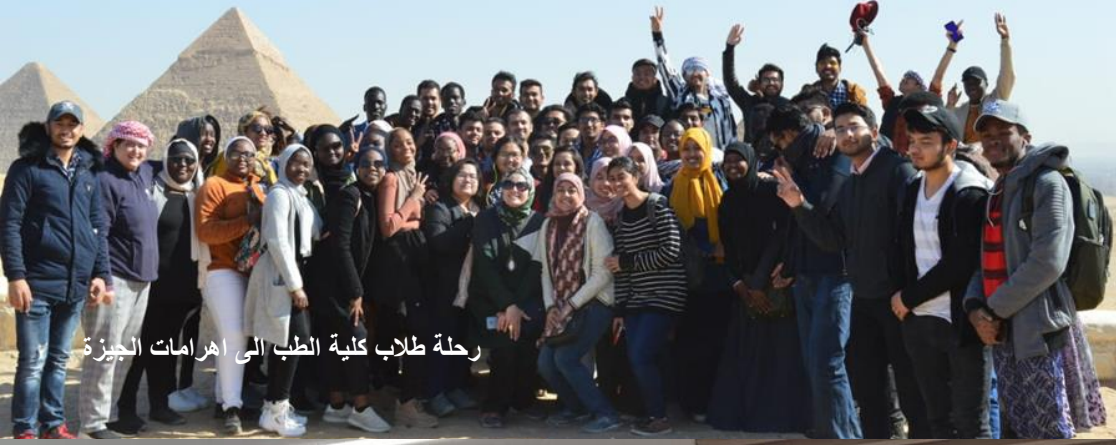
رحلة طلاب كلية الطب الى اهرامات الجيزة