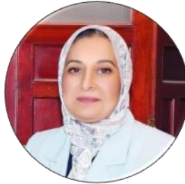
أ.د. غادة فاروق نائب رئيس الجامعة لشئون المجتمع وتنمية البيئة والقائم بعمل نائب رئيس الجامعة لشئون الدراسات العليا والبحوث