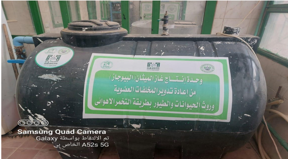
Samsung Quad Camera Galaxy تم الالتقاط بواسطة A52s 5G الخاص بي