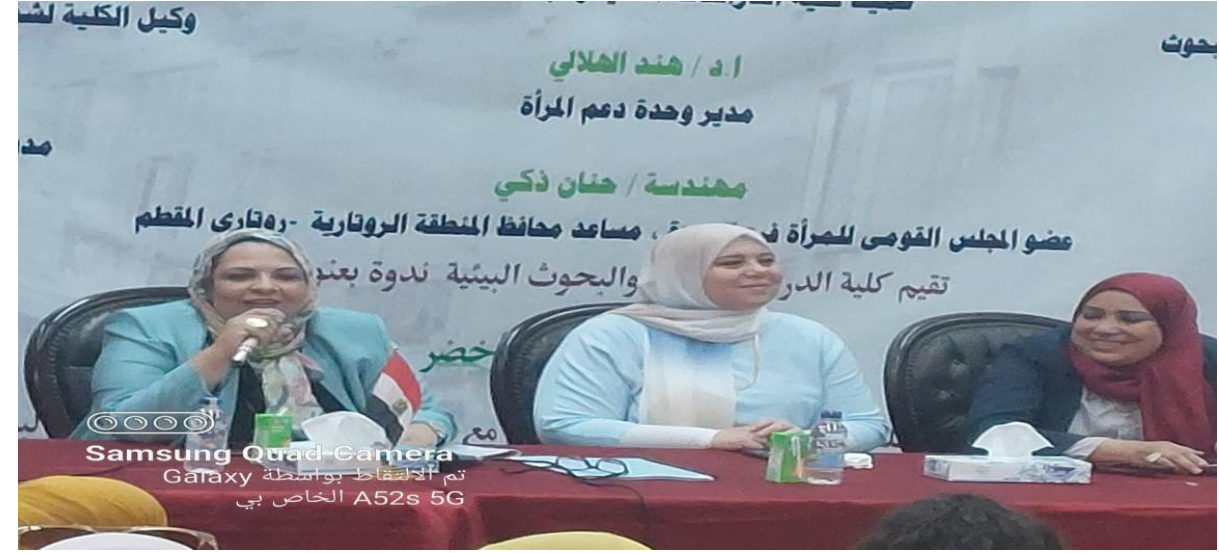
Samsung Quad Camera Galaxy تم الالتقاط بواسطة A52s 5G الخاص بي