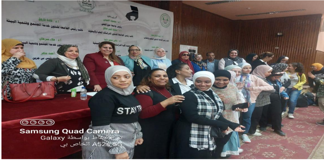
Samsung Quad Camera Galaxy تم الالتقاط بواسطة A52s 5G الخاص بي